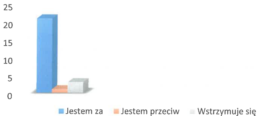
Rys. 1 . Liczba głosów oddanych na formularzu w wersji elektronicznej