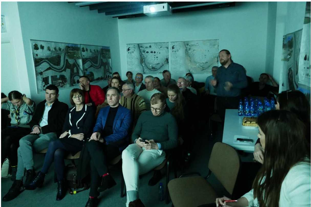
Spotkanie informacyjno-konsultacyjne w BWA.